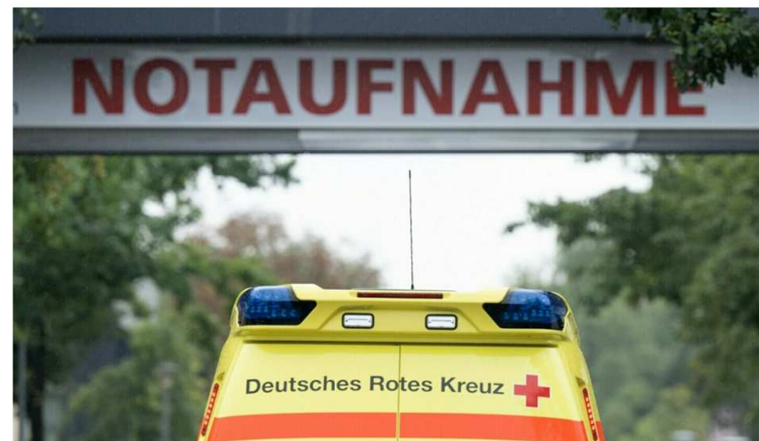
Alarmruf in eigener Sache: Die meisten Krankenhäuser im Land schreiben rote Zahlen, Besserung ist nicht in Sicht.

Die Wartezeiten für Operationen an den baden-württembergischen Krankenhäusern haben sich verlängert. 66 Prozent der Krankenhausgeschäftsführer im Land geben an, dass die Wartelisten für planbare Eingriffe länger geworden sind. Das ist das Ergebnis einer Befragung der Baden-