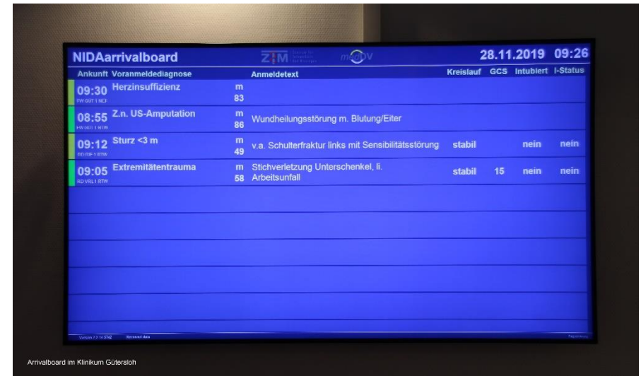
Arrivalboard im Klinikum Gütersloh