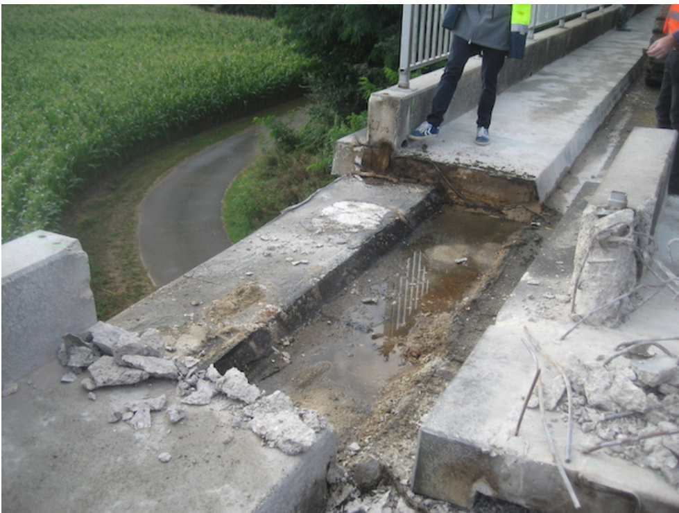
Abdichtung beschädigt, Durchfeuchtung des Brückenüberbaus