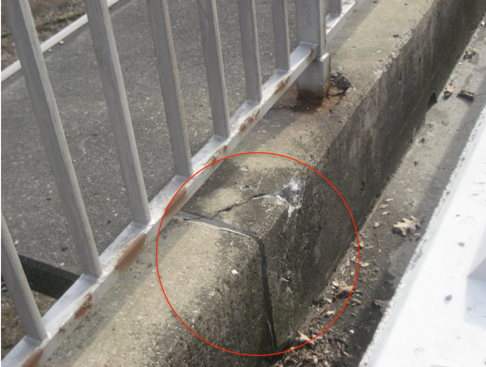
Betonaufkantung gebrochen, in Folge der gekippten Kappen