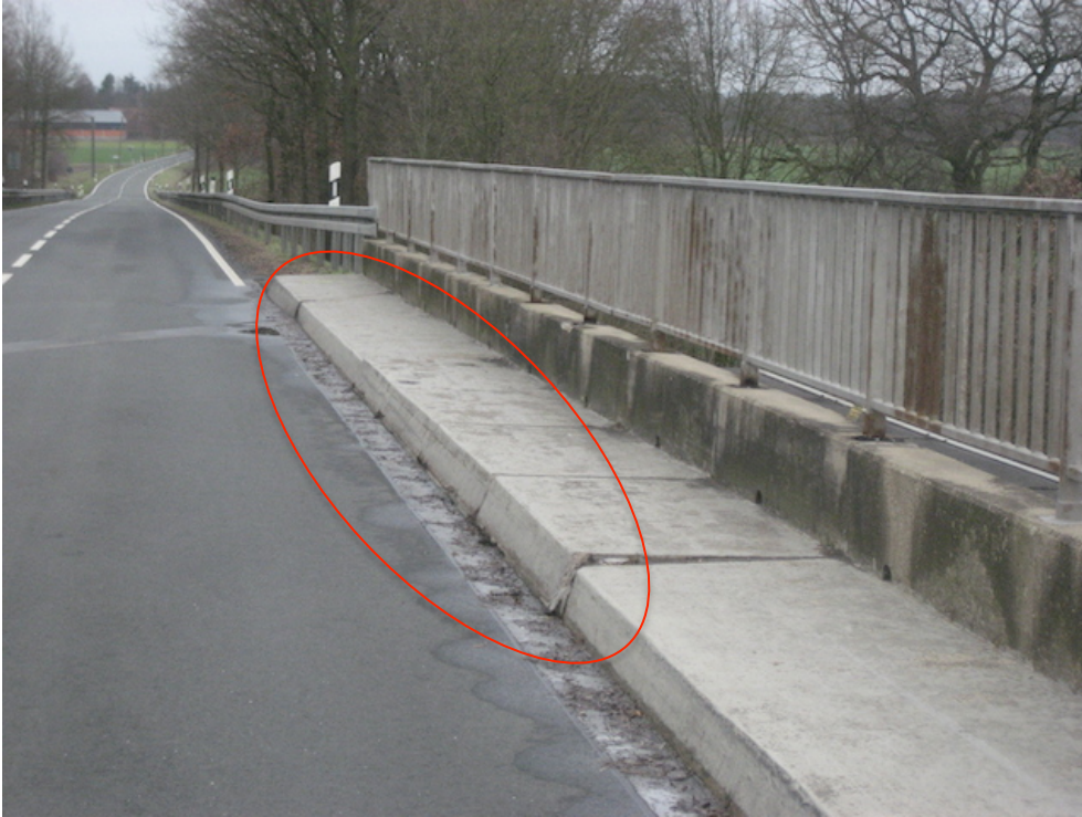
Fahrtrichtung Kattenvenne, gekippte Kappen über dem Gleis Richtung Münster