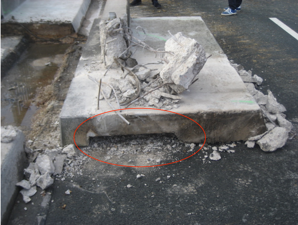
Profil der ausgebauten Kappe, Aussparung für den horizontalen Schubhocker