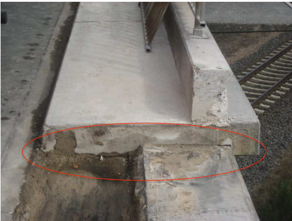
Fertigteilkappe am Brückenrand ohne Verankerung, Lagesicherung durch Eigengewicht