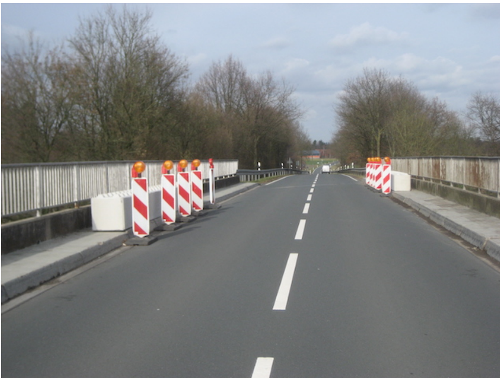
Blickrichtung Kattenvenne; Sicherung der Kappen mit Betonblöcken als Ballastierung