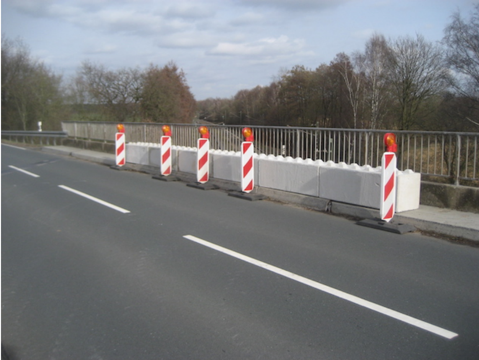
Sicherung auf der Ostseite