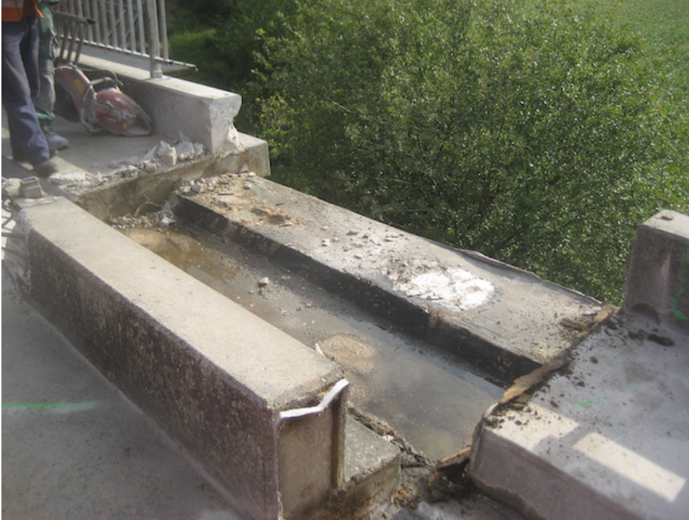
Abbruch einer Fertigteilkappe, ständig Wasser unter den Kappen