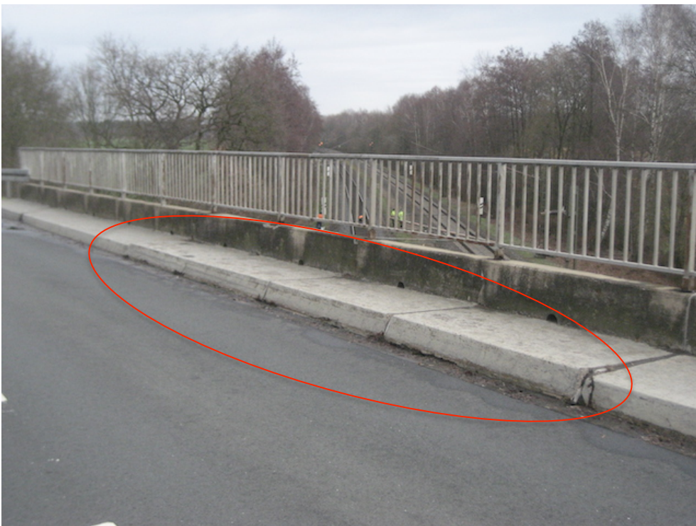
Fertigteilkappen mit Berührungsschutz gekippt