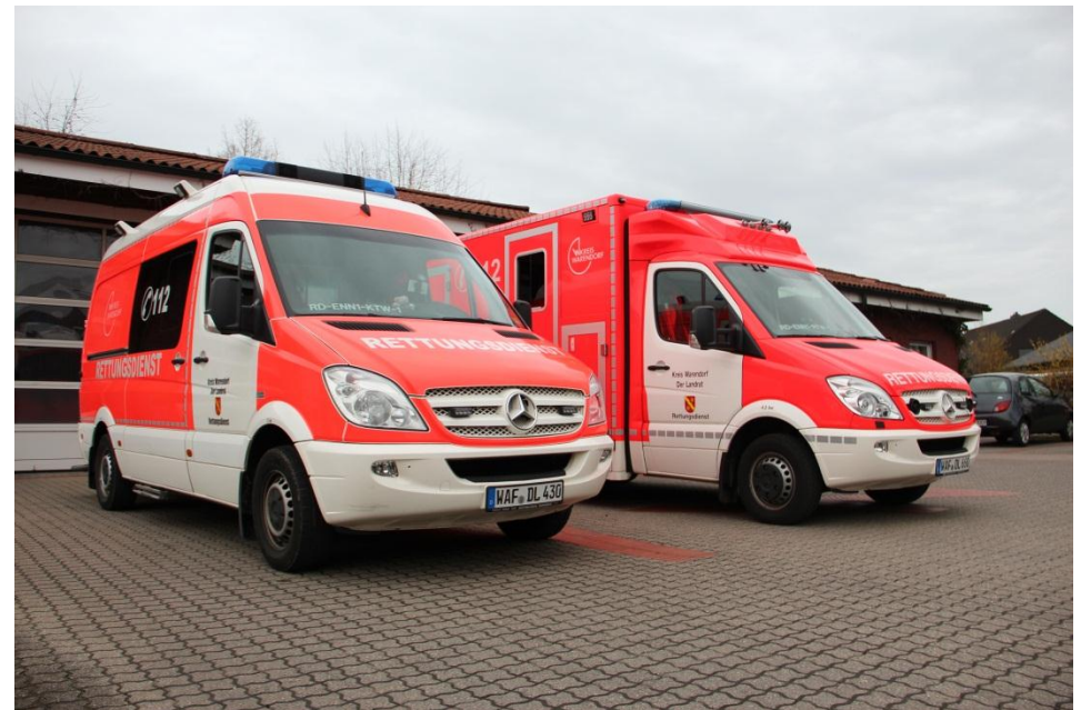
Aktueller KTW / RTW