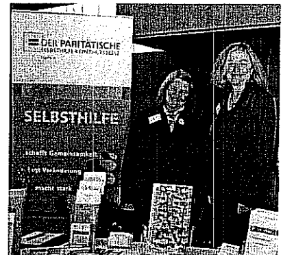
Foto: Monika Dierks/Selbsthilfe-Kontaktstelle Hamm (li.) und Ute Silwedel (Selbsthilfe-Kontaktstelle Kreis Warendorf) auf dem Leukämie-Symposium in Hamm.