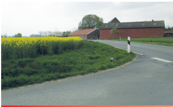
Sichtbehinderung durch Raps

Der Straßenunterhaltungsdienst Ihrer Kommune stellt durch regelmäßige Streckenkontrollen sicher, dass sich die Straßen und Wege in einem verkehrssicheren Zustand befinden. Umstände, wie zum Beispiel Sichtbehinderungen in Kreuzungsbereichen, die eine Gefährdung der Verkehrssicherheit nach sich ziehen, muss der Straßenunterhaltungsdienst dokumentieren. Auf die Beseitigung der Sichtbehinderung wirkt die jeweils zuständige Behörde hin.