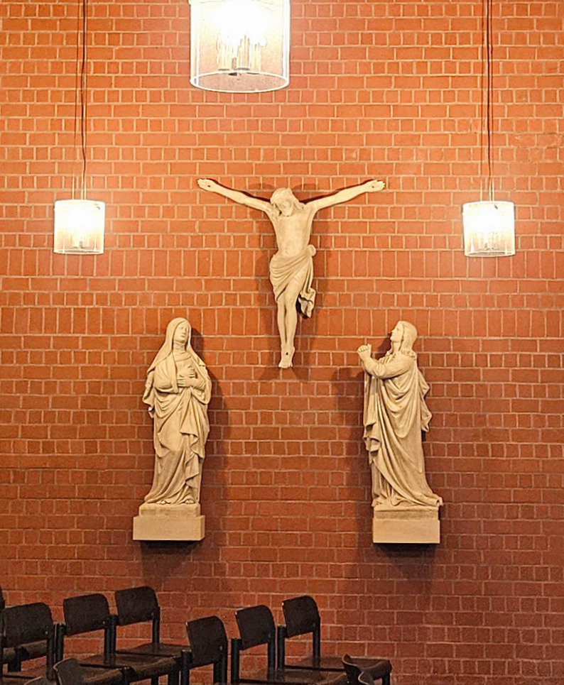
Original-Figuren in der Trauerhalle des Westfriedhofes an der Sedanstraße

Im Jahr 1901 wurde an der Kampstraße die Kreuzigungsgruppe – eine aufwendige Arbeit im Stil der Neugotik aufgestellt. In einem Visitationsbericht von 1656 ist belegt, dass die Fronleichnamsprozession entlang der Stadtmauer verlief und die fünf Stadttore jeweils durch ein Kreuz gekennzeichnet waren. Von den Kreuzen der damaligen Zeit – man schätzt diese aus der Zeit des dreißigjährigen Krieges – ist keines mehr vorhanden, aber die Orte der Stadttore sind noch heute als christliche Segensstationen markiert.