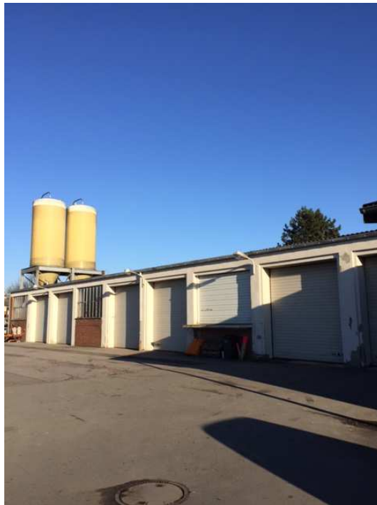
Bild 2: Ansicht Fahrzeughalle / Waschhalle und Sozialbereich rückseitig